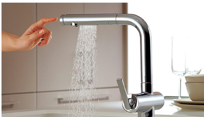
水ほうき水栓LF(ハンドシャワー式・エアイン)なら

しかし、ショールームで見たエコ機器にどんなに心引かれても、実際に大がかりなリフォームはそうそうできるものではありません。そこで比較的楽に取り入れられそうなものとして、私が今気になっているのは水流に空気を含ませた水栓です。すでにお風呂のシャワーヘッドをそのタイプに交換された方もおられるかと思いますが、それが台所の水栓にも取り入れられているのです。