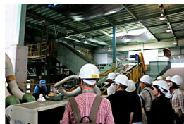
古賀清掃工場工場見学

どの施設でも、3Rの工夫やその仕事に携わる人の思いに触れることができる内容です。見学後、自らが3R実践者になってもらえるような見学会を目指しています。