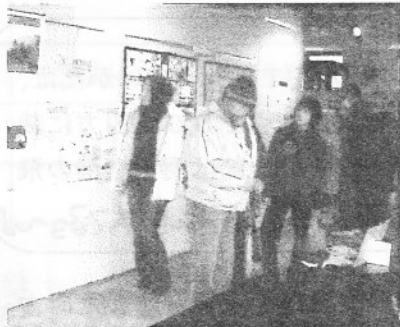
▲展示コーナーのようす

展示コーナーには、たくさんの団体の力作模造紙が展示してあり、エコけんが連携教室で関わった福間小の子ども達の壁新聞もありました。うれしくて思わずじっと見入ってしまいました。エコロの森からは地球温暖化の現実を伝える写真パネルや、開発グループの作品を掲示しました。セーターから作ったワニやティッシュカバーが特に人目を引いたようです。