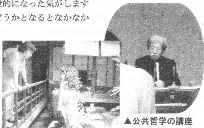
▲まちやで昼食をとりました

「協働」という言葉は以前より一般的になった気がしますが、では実社会での導入や継続はどうかとなるとなかなか難しいようです。異なる組織が力を出し合うには、やはり世話人が必要なのでしょうか。それを職能として提唱されているのが世古さんの「協働コーディネーター」なのだと思います。今回はそれを支える哲学についての講義や、事例紹介がありました。また、合意形成に向けたファシリテーターとしての練習もありました。ただ、なんと言っても世話人には双方を取り持つための技術や知識はもちろんのこと、思いや人となりは欠かせません。短期間の講習だけでは、習得は難しいなあと思った次第です。結局、日頃の姿勢を正すことに思いをはせたのが大きな収穫といえるかもしれません。また、同世代ながらこの道で先を走る方に会えたのも刺激になりました。