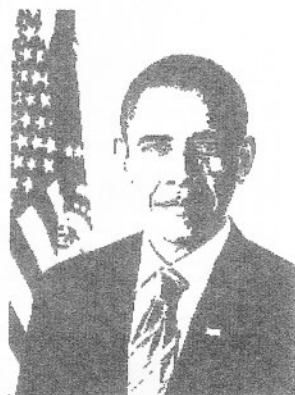
▲オバマ大統領で有名に

日本でも環境省が「日本版グリーン・ニューディール構想」（仮称）の策定に乗り出しました。「緑の経済と社会の変革」をキャッチフレーズとして、環境対策で経済、雇用拡大を図る予定だそうです。