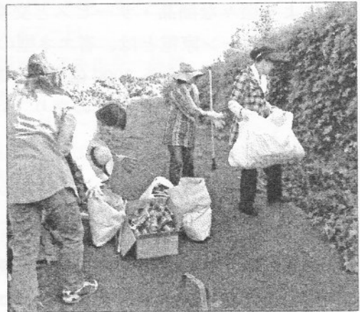
ごみ袋がすむにいっぱい...

また、エコけん1%クラブは、だれでもできるボランティア活動を、毎月1度計画します。現在予定している内容は、清掃やいきもの調べです。事前にE-mailでお誘いしますので、皆さんと一緒にしましょう。