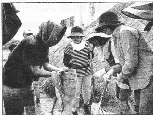
▶西郷川の調査作業

講生として学ばせてもらう貴重な機会でもあります。リーダー養成講座は、今年の川編をもって、予定の自然環境フィールドを一巡しました。