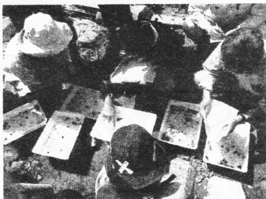
▼川の生物を分類しました

今年は番外編として、参加者で作った企画を12月に実行します。企画作りのはじめには、福津市環境フォーラムでより多くの方に呼びかけてやろう、という意見が大勢を占めました。しかし、種々の状況(企画資源)からメンバーの身の丈サイズの企画に、満足感をもって、落ち着くことができたのです。私も「思いを形に」する過程におつきあいできて幸せでした。