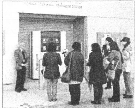
▲水素ステーション

水素は軽くて可燃性ガスであることから、水素研究センターは幾重にも安全対策がなされていました。今回訪問した研究室では、水素は金属部材の中に入って劣化を早くする性質があることから、様々な環境での金属部材の疲労度の研究が行われていました。また、ガソリンスタンドのような水素ステーションでは、直接、車に水素をチャージできるようになっており、私たち市民の手元に届くまであと1歩でした。