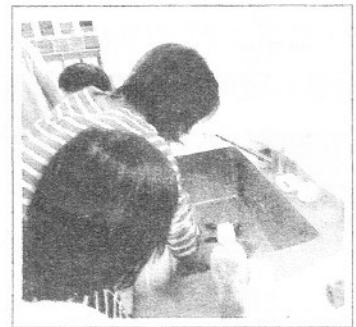
▲油汚れがお得意! 「廃油キャンドル教室」でも使用

*1月と2月にサンフレアでエコエコクッキング教室を予定しています。その教室でこのおそうじ水体験もできます。