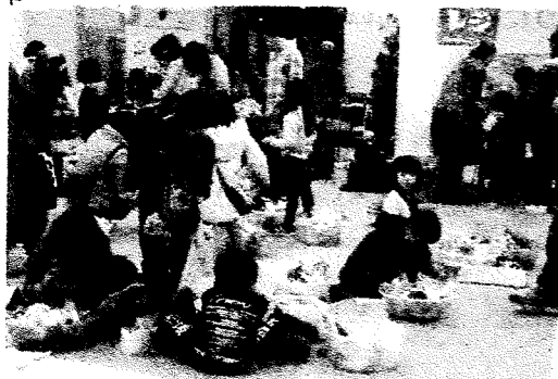
▲3/18のメガかえっこパザールのようす