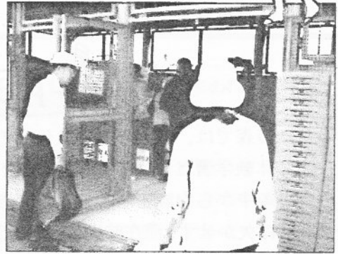
▲たくさんの方が利用されています

「古紙」は、新聞・段ボール・雑誌の3種類に分けそれぞれひもで結びます。(下記参照)