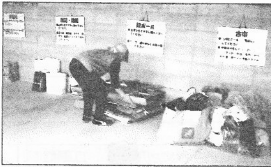
▲まだ始まったばかりの古紙・古布回収 しているのも耳にしました。

収集場所には、丁寧な説明が書かれたプレートが品目ごとに掛けてありました。思っていた以上に多くの方がこの収集場所を利用されているようです。分別BOXの前には順番を待っている列もありました。