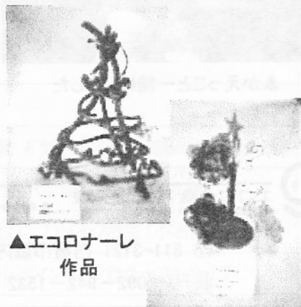
▲エコロナーレ作品

「エコロナーレ」という、エコロを広げる工作物の展覧会+コンクールを初めて実施しました。投票するのは全ての来館者。受付でお渡ししたペットボトルを会場で分別の一手間体験をしていただいたから、好みの作品に投じてもらいました。現在、3位までの作品をエコロの森ステーション1Fに展示していますので、どうぞお立ち寄りください。お待ちしております。