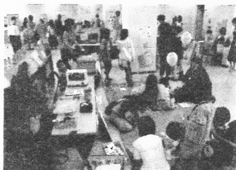
▲かえっこと一緒にしました

やってみようと思ったきっかけは、面白そうだったし、お小遣い稼ぎが出来る といわれたからです。エコクラフトは午後からでしたが、準備のため午前 中から作業していると、お客さんが興味を持ってくれたので、たくさんパーツ を準備しました。