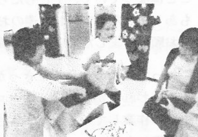
▲生ごみ処理の提案

この環境フェスタの進行を支えたのは、各参加団体のスタッフはもちろん、エコロの森の登録ボランティアさん達でした。事前の打ち合わせから当日までの間、気づいたことをいろいろ提案してもらいながら協力いただきました。普段、皆さんが一同に会する機会はほとんど無いだけに、当日はよい交流の場にもなりました。