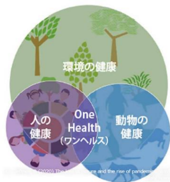
ワンヘルスのイメージ

新型コロナウイルス感染症は人にも動物にも感染する「人獣共通感染症」と言って、ウイルスを持つ野生動物と人との接触で起こっています。SARS やマダニによる重症熱性血小板減少症候群も同じです。世界の人口増加や生活の変化による環境破壊、気候変動などにより、野生動物と人との距離が近くなり、人獣共通感染症が増えているそうです。