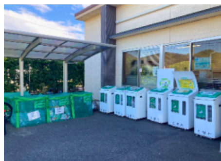
古賀市資源回収ボックス