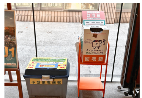
小型家電回収ボックス