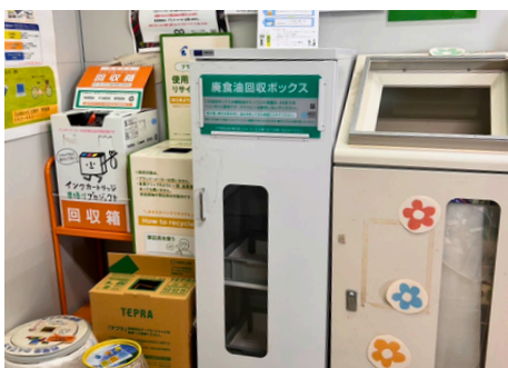
廃食油や筆記具 カートリッジ等の回収ボックス